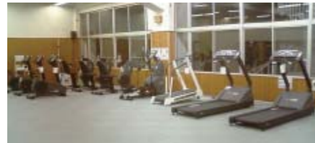
心肺持久力系マシーン